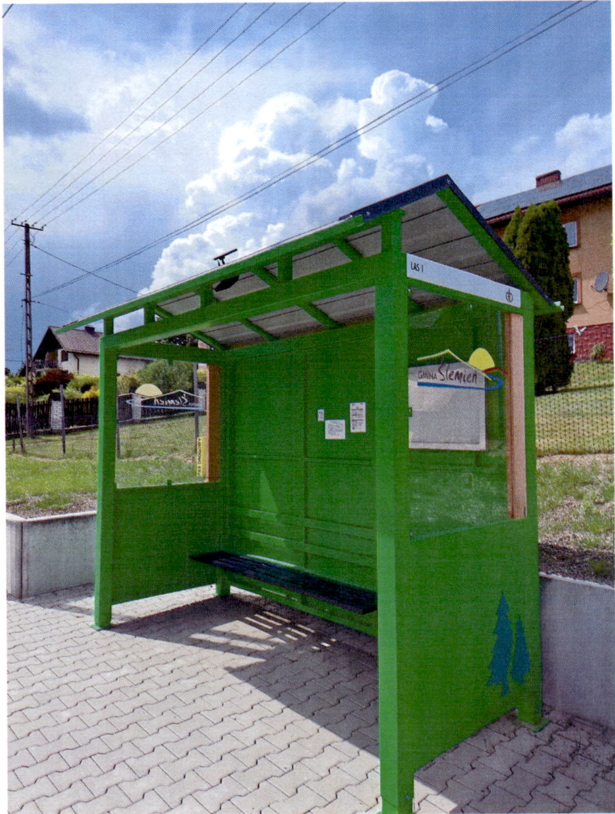
Zdjęcie ma jedynie charakter poglądowy.